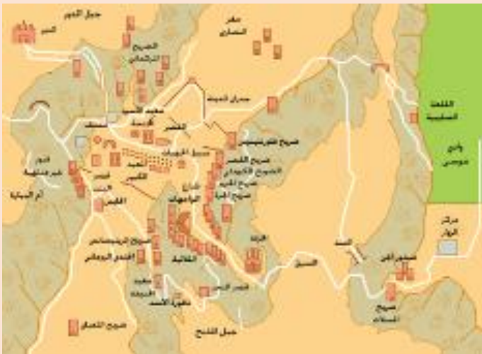
موقع خزانة فرعون من خريطة البتراء الاثرية

تتكون الخزانة من واجهة فيها طابقين بعرض 25 متر وارتفاع 39 متر وقد تم افراغ مئات الاف الأمتار المكعبة من الحجر الرملي من الخزانة حيثما تمت إعادة استكشافها في القرن التاسع عشر, يتكون الطابق السفلي من ستة أعمدة على طول الواجهة الامامية تقف فوق مصطبة في وسطها درج, وتتوج الاعمدة من الأعلى بثلاثة ارباع عمود, يبلغ طول العمود في الطابق السفلي حوالي 12 متر وفي لطابق العلوي 9 امتار, وأيضا يظهر في الواجهة المزيد والمزيج من الفنون المعمارية المصرية والهلنستية مع الطابع المعماري النبطي, وتتكون الخزانة من ثلاث حجرات من الداخل اثنتان على جانب وواحدة في المنتصف الحجرتان الجانبيتان خاليتان ما عدا قبر حفر في الجهة الغربية اما الحجرة التي في المنتصف فيصعد اليها بدرج ويبلغ طولها 12.5 متر وعلى جوانبها الثلاثة توجد حجرات صغيرة للدفن ويوجد على جانبي الخزانة من الخارج ثقبون صغيرة على الجانبين بشكل مزدوج في النصف الأعلى من الخزانة.